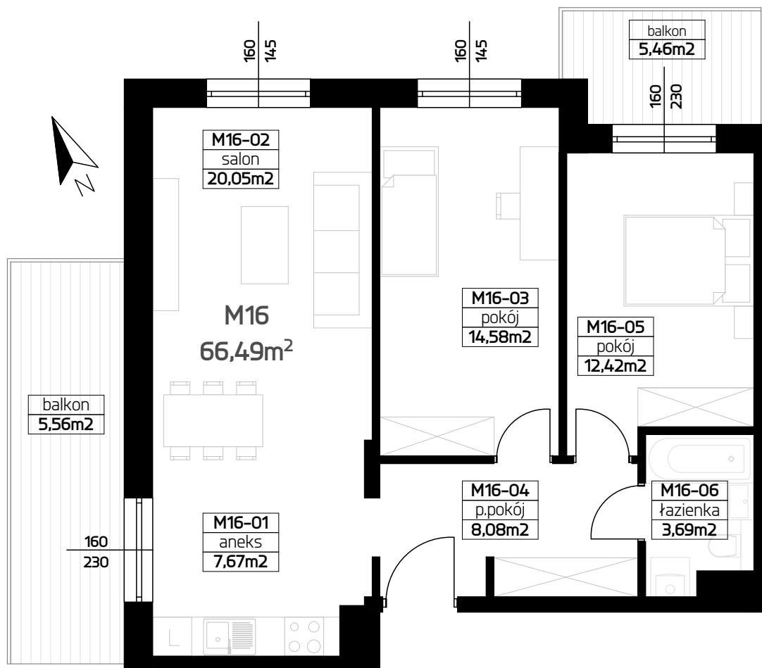
RZUT MIESZKANIA 1:75